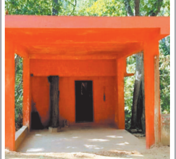
बाँकपुरपुर। सोनहल के निकट जंगलों के बीच बने देवी धाम मंदिर में एक वृक्ष को बचाते हुए मंदिर का निर्माण कराया गया। वृक्ष साक्षात् देवता है और मंदिर उसका आंचल। जंगल में प्रकृति और परमात्मा का अद्भुत संगम देखने को मिला।