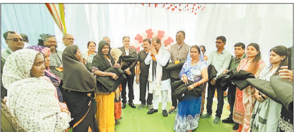
सफाई कर्मियों को कंबल, गर्म टोपी भेंट कर किए सम्मानित

इस अवसर पर डोर टू डोर कवरा कलेक्शन करने वाली स्वच्छता दौड़ियों एवं सफाई कर्मचारियों को कंबल व गर्म टोपी वितरित कर सम्मानित किया गया। ठंड के मौसम में यह पहल जरूरतमंद कर्मियों के लिए बड़ी राहत साबित हुई। नपाध्यक्ष ने कहा कि नगर की स्वच्छता व्यवस्था की असली धुरी स्वच्छता दौड़ियां और सफाई कर्मचारी हैं। इस अवसर पर