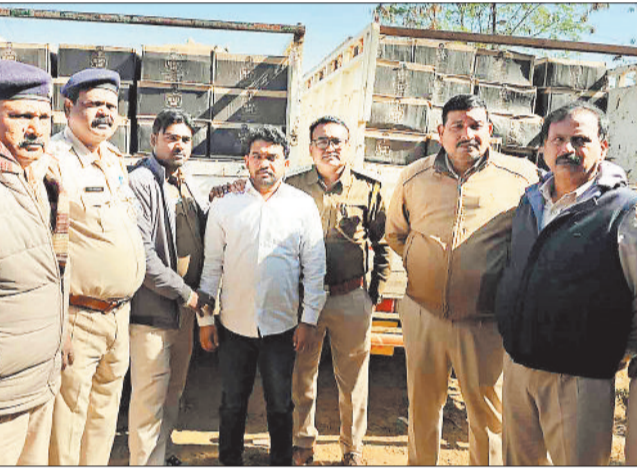
जख्त शराब के साथ आबकारी अधिकारियों की गिरफ्त में आरोपी।

संभाग में बड़े पैमाने पर दिगर राज्यों की शराब को खपाने का कार्य लंबे समय से जारी है। पूर्व में भी कई अवैध कारोबारी आबकारी विभाग के हत्ये चढ़ चुके हैं और उनके पास से बड़ी मात्रा में दिगर राज्यों की शराब जब्त की गई है। नए साल के आगमन व नव वर्ष के के मद्देनजर संभाग में नशे के अवैध कारोबारियों के विरुद्ध संभागीय उड़नदस्ता टी द्वारा अभियान चलाकर कार्रवाई तेज कर दी है। इसी कड़ी में आज संभागीय उड़नदस्ता टीम को उस समय बड़ी सफलता हाथ लगी जब टीम ने दरिमा रोड स्थित एक गोदाम में दबिश देकर 40 लाख कीमत के 300 पेटेी अंग्रेजी शराब के जख्त किया साथ ही शराब विक्रेता को धर दबाया। आरोपी के विरुद्ध आबकारी एक्ट के तहत अपराध दर्ज कर न्यायालय पेश किया जहां से उसे जेल भेज दिया गया है। नए न्यू ईयर को लेकर अंग्रेजी शराब के अवैध कारोबारी न सिर्फ सक्रिय हो गए हैं बल्कि दूसरे राज्यों से बड़ी मात्रा में अंग्रेजी शराब अपने गोदाम व अन्य जगह संग्रहित कर रखने लगे हैं। ऐसे में संभागीय उड़न दस्ता की टीम द्वारा शहर सहित जिले के विभिन्न गांवों में गश्त बढ़ा दी है। वर्ष के अंतिम दिन आबकारी उड़नदस्ता टीम को